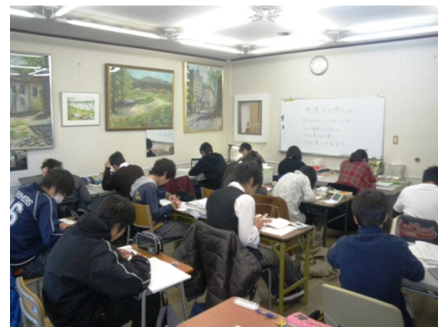
私語厳禁の快適な40席の自習室で勉強もはかどります！ 「家で勉強できないなら日米で勉強すればいい。」

勉強は受験で終わるものでなく、一生続くものであり、それを支えるやる気の持続こそが最も大切であると日米は考えます。そこで、日々の授業でやる気を引き出す仕掛けをすることはもちろん、そのやる気を持続させるための環境を整えています。例えば、常時使用可能な40席の自習室。ここでの学習が数々のドラマを生み出す原動力になっています。また、インターネット常時接続の20台のパソコン。ウェブや映像授業を用いた学習も可能です。その他各種検定の対策指導(無料)や授業後、ときには深夜に及ぶ講師室での質問のやり取りが、日米の日常風景になっています。